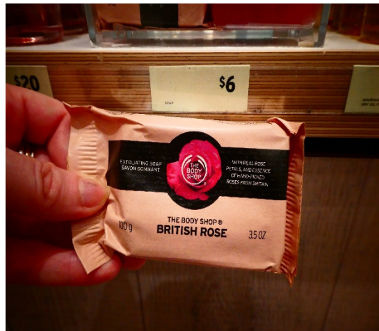
圖 10、玫瑰潔膚皂 100G