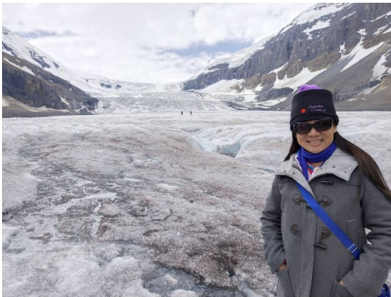
圖 6、哥倫比亞大冰原圖

Q11：根據圖 7，我的身高約 160cm，請問巨輪冰原雪車的輪子半徑大約有多長呢？