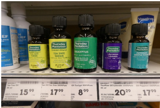
圖 4、澳洲星期四農莊-尤加利葉精油

用完晚餐,我和同事們到飯店旁的大賣場進行採買,其中有一商品---「澳洲星期四農莊-尤加利葉精油」,50ml 標價 8.99 元加幣(含稅),立即吸引我的目光,(如圖 4),由於我出國前才和同事合購「澳洲星期四農莊-尤加利葉精油」200ml,2 罐 2859 元, Q9: 根據圖 4, 請問這一款精油, 臺灣和加拿大相比, 誰賣得比較便宜呢?