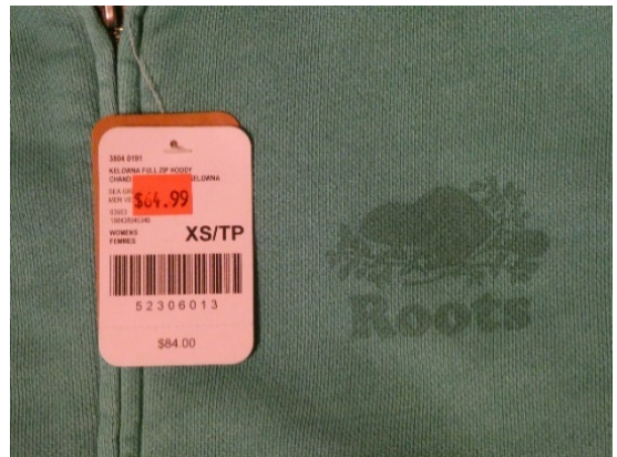
圖 8、Roots 外套

第七天(當地時間 07/22(一))，溫度約攝氏 10-30 度，上午第一站，我們前往「強斯頓峽谷」，是由強斯頓河經年累月穿鑿後形成深邃峽谷，在以雄偉壯麗景觀著稱的加拿大洛磯山脈裡，營造出纖細又富有變化的自然景色，極似臺灣的太魯閣峽谷。第二站，我們前往風景瑰麗的優鶴國家公