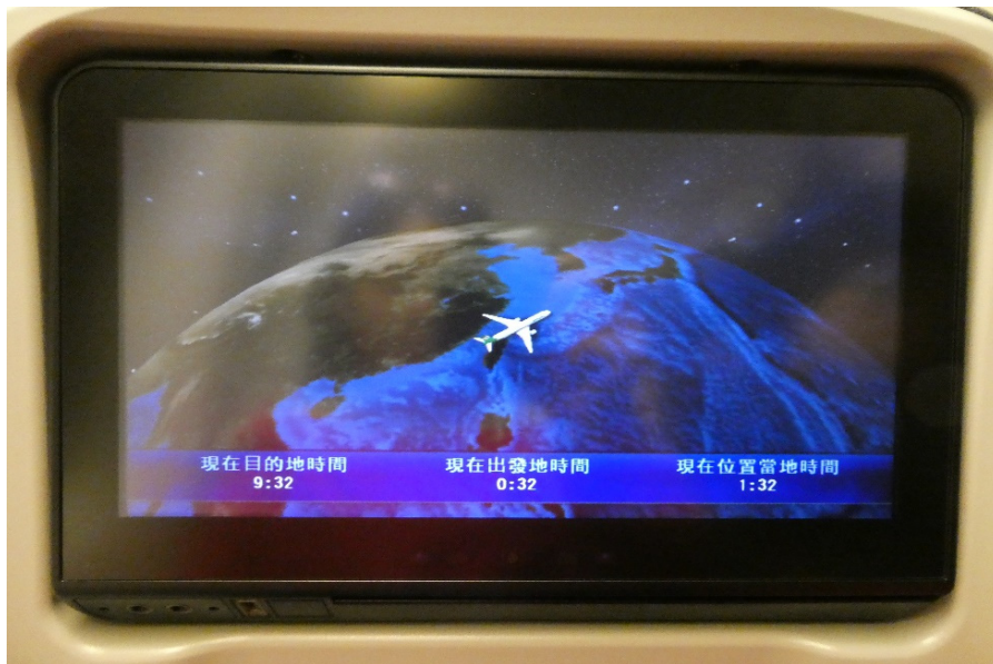
圖 1、飛機剛起飛不久時的飛行資料

以下表格一是我們這趟旅遊去程時飛機航班的資料，而表格上所寫的時間指的都是當地的時間。 Q6: 根據表格一的資料，請問從臺灣桃園機場到抵達加拿大溫哥華機場，這一趟去程總共花了多少飛行時間呢？