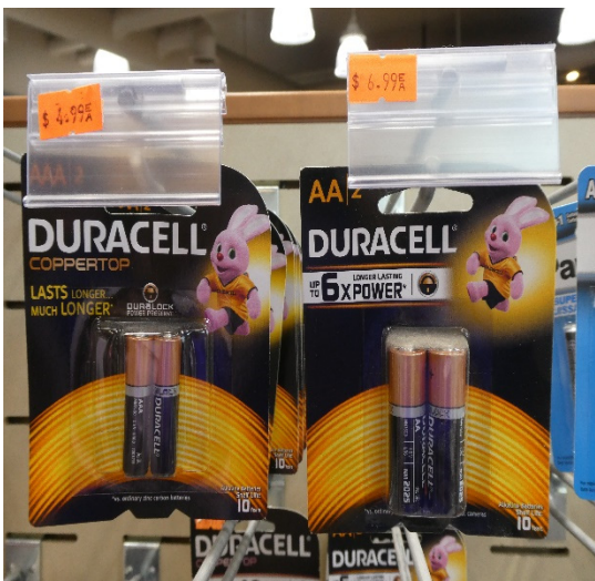
圖 3、AA(3 號)電池+AAA(4 號)電池

第四天(當地時間 07/19(五))，溫度約攝氏 5-15 度，會下雨，所以領隊請我們攜帶雨具。第一站，先到羅伯森山省立公園