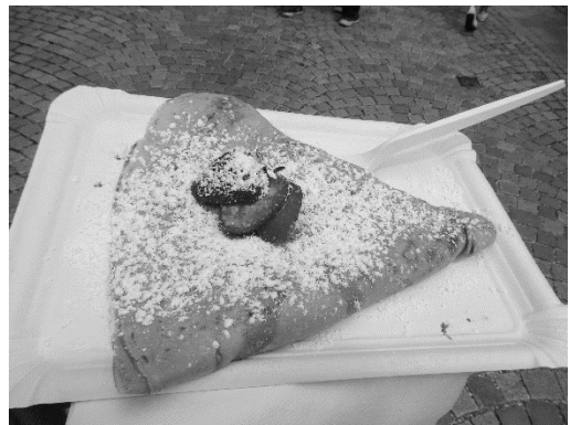
圖 5：巧克力口味的可麗餅

的一張 100 元紙鈔，跟領隊換了 10 張 10 元的小額紙鈔，才解決當下這尷尬的場面。從這個事件，我又體會到歐洲人做生意的不同風格，如果是台灣人做生意，儘管顧客拿了一張千元大鈔買低於 50 元的物品，老闆都會想盡辦法去跟隔壁的店家換零錢，反觀在這裡，歐洲人似乎就十分「隨性」了，沒零錢可找時，他寧可把錢退還給你，也不會去隔壁換零錢，哈！心想著，究竟是台灣人太「熱心」了？還是太愛「賺錢」了？就由大家各自解讀囉。