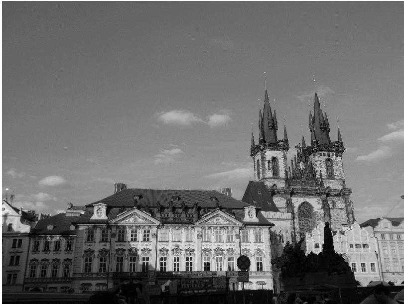
圖 10：巴洛克風格和哥德式建築