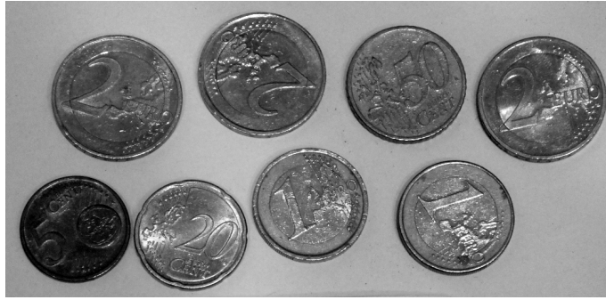
圖 18：剩下的歐元硬幣