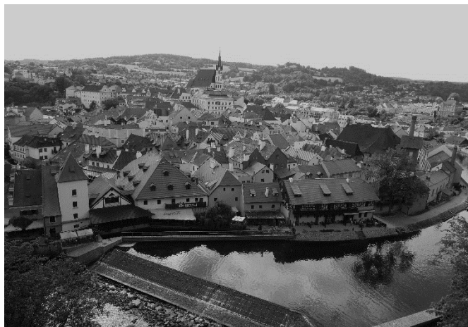
圖 7：舊城區(Old Town)