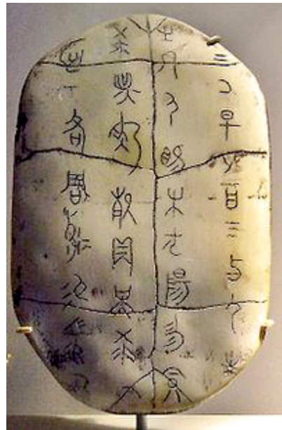
圖五-(二)、龜甲上的甲骨文。