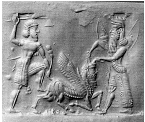
圖三、吉爾伽美什(圖左)與恩奇杜(圖右)共同殺死洪巴巴(圖中)

被殺觸怒大地之神。不久， 恩奇杜 病倒了，病中夢到眾神一起宣布他的死刑。醒後，病了九天就死了。同理， 吉爾伽美什 也知道自己難免一死。