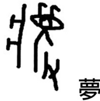
圖五-(一)、「夢」的甲骨文字。「夢」字左側是表示睡眠的人；右側是女人，她正在作法。

數量的研究報告（西林真紀子，2005；宋鎮豪，2005；前原 ayano，2012；劉文英，1989；名島潤慈，1996；湯淺邦弘，1998）。本文僅參考以上各先進研究報告，並以周禮為中心解釋「占夢官」或「占夢術」如何探討夢的吉凶。