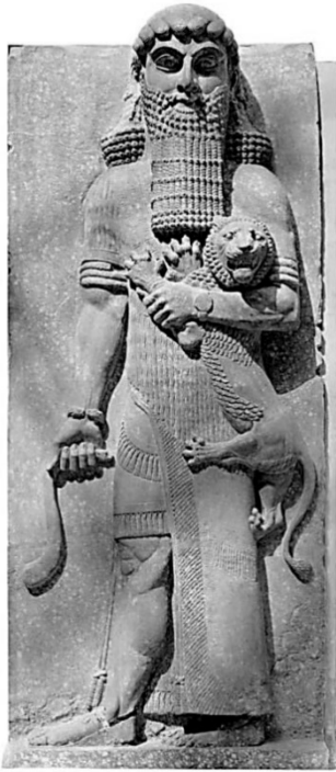
圖二、吉爾伽美什捕獲獅子的浮雕(法國羅浮宮美術館)