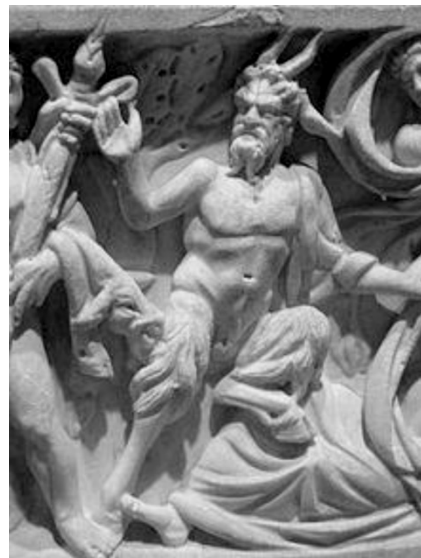
圖四、沙泰神浮雕

tyros，這個字含有『泰爾是你的(sa Tyros)』的意思，這裡所說的「你」表示是大帝，是您啦！因為沙泰神在您的盾牌上跳舞。這個夢明白告訴您，您將成功奪得泰爾城！」。亞歷山大聽到如此解夢，心理非常高興也增加了獲勝的信心，果然沒有多久，亞歷山大攻下了泰爾城。這夢後來為是歷史上非常經典的預言夢。