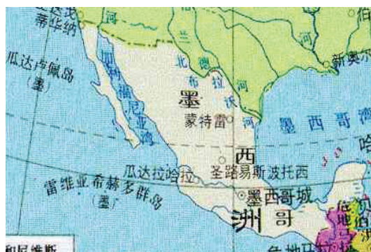
圖 1：墨西哥地理位置圖

網路上說墨西哥的氣候因緯度差異而有很大的不同！查了一下地圖，根據圖 1，看到墨西哥的地理位置（緯度）和台灣相似，境內都有北回歸線通過，而墨西哥城又更為南端，若照這種說法，目前的氣溫也應該和台灣一樣都屬於熱帶氣候，夏天的氣溫平均應該都會在 30°C 以上；但是 PME32 的大會給我們的資料卻指出墨西哥城的氣溫大約在 13°C～24°C。根據上述的這些資料，你認為應該以哪一個資料為主來準備衣服呢？