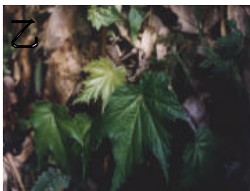
乙 戀大秋海棠 - 性喜涼溼的環境，莖富含水份，是著名的野外求生植物