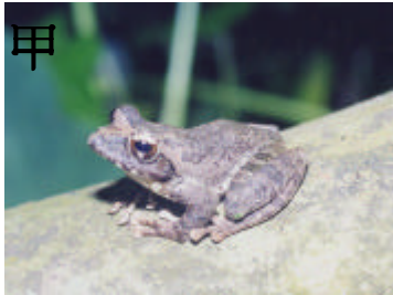
甲 枯樹蛙 外表顏色會隨環境變化，常棲息於溪流邊的潮溼處