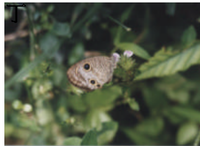
台灣波紋蛇目蝶 - 喜歡陰暗的環境加上體色不顯眼，常被忽略，但卻是常見的蝴蝶