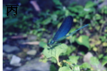
丙 白痣珈蟪 - 成蟲出現 3-12 月。雌蟲交尾後會將卵產於水邊植物的草叢中，或水中植物莖部、樹根上