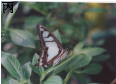
寬青帶鳳蝶 - 飛行速度極快，停下來休息的機會不多

滿月圓地區不但擁有著自然的地質教室，更是一座活生生並具多樣性的自然生態教育場所，這裡蘊藏著無限的生命，等著你我一起去探索牠們的生態世界。