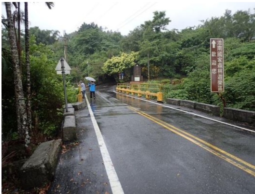
池南森林遊樂區橋可觀察第二次河川襲奪造成的襲奪灣。