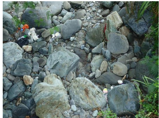
在池南橋下瞰文蘭溪的河谷觀察。