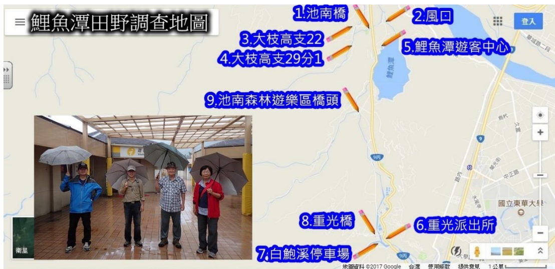
【圖 1 鯉魚潭田野調查地圖 地圖影像取材自 Google 地圖】

本研究目前已進行二次(全員)及六次(各別)野外實察活動，正在建立地質地形特殊教學資源的淘選及製圖建檔之工作。完成進度大約 50%。(天候不佳陰雨)