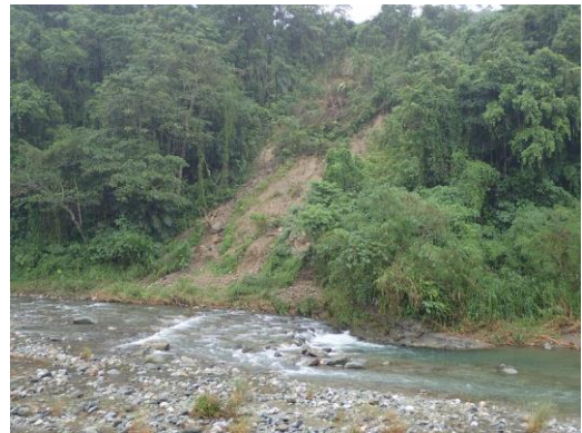
白鮑溪因靜態回春造成的急流。