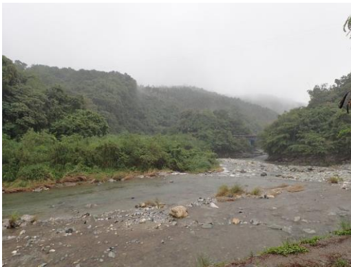
白鮑溪上的荖溪橋、環流丘與河階。