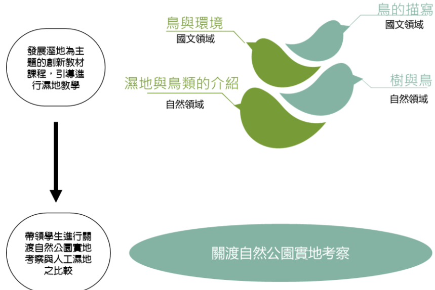
圖三 計畫目的與執行流程之對應圖