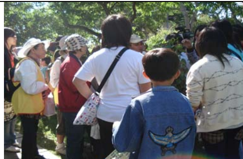
社區民眾亞泥蝴蝶園參觀 97. 10