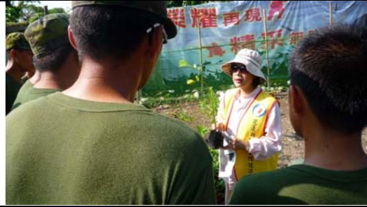
部隊協助民勤里棲地 97. 09. 06