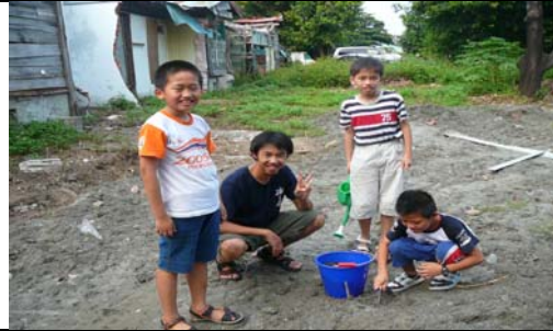
棲地認領 97. 09. 20