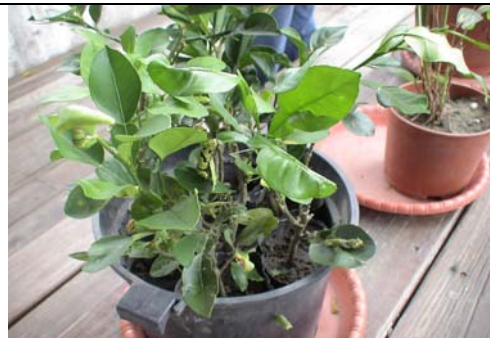
大豐生態蝴蝶園—生命樹 97. 11