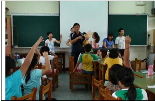
策略聯盟學校演講 97. 06. 25