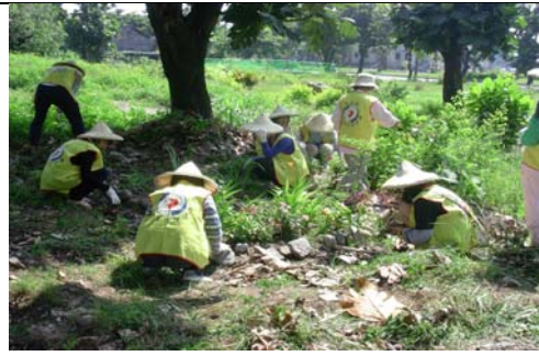
拔草種植蜜源植物 97. 08. 16