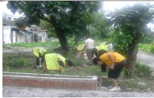
民德里棲地再維護 97. 10. 04