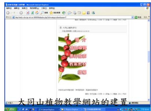
大同山植物教學網站的建置