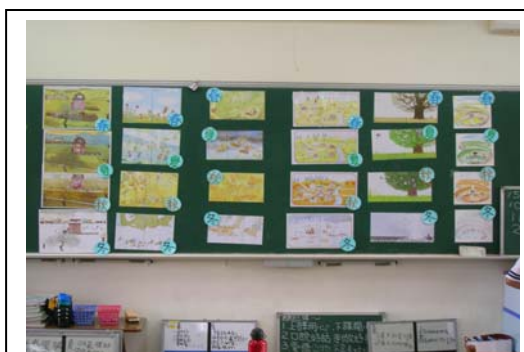
圖二：「發現秋天」繪本教學圖片。