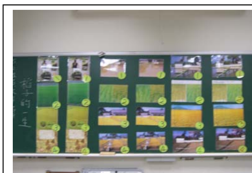
圖三：「稻子的一生」繪本教學圖片。