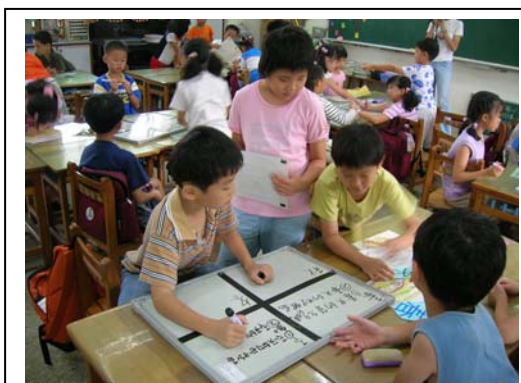
圖四：每組學生共同討論繪本內容。